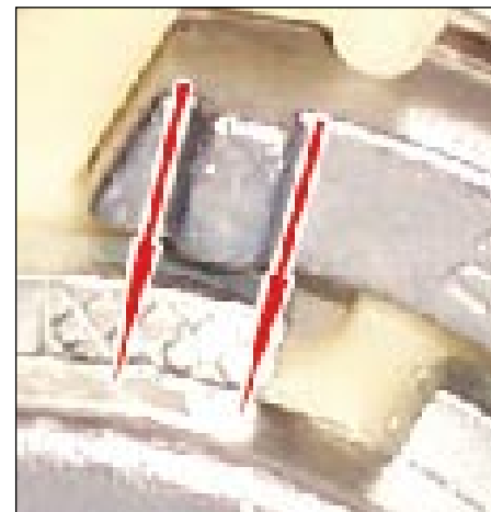
Fot. 5: Oba znaki są poza rowkiem (strzałka). Powtórzyć regulację napięcia!