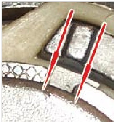
Fot. 4: Oba znaki pokrywają się z rowkiem (strzałka). Montaż jest prawidłowy!

W celu zapewnienia właściwego działania wskaźnika zużycia, wszystkie elementy jak pasek, napinacz i rolki prowadzące, muszą być wymieniane jednocześnie. LuK zaleca stosowanie zestawu z paskiem tzw. KIT (Nr LuK: 530 0082 10 ), z uwagi na jednakowe zużycie wszystkich rolek. W przypadku posiadania właściwego paska rozrzędu w jakości OE, zaleca się stosowanie zestawu rolek bez paska tzw. SET (Nr LuK: 530 0082 09 ).