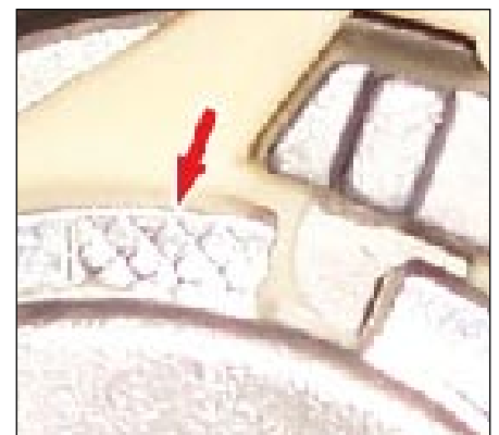
Fot. 3: Kratownica

Wskaźnik ten charakteryzuje wytłoczona kratka obok szczeliny nastawnej napinacza (fot. 3).